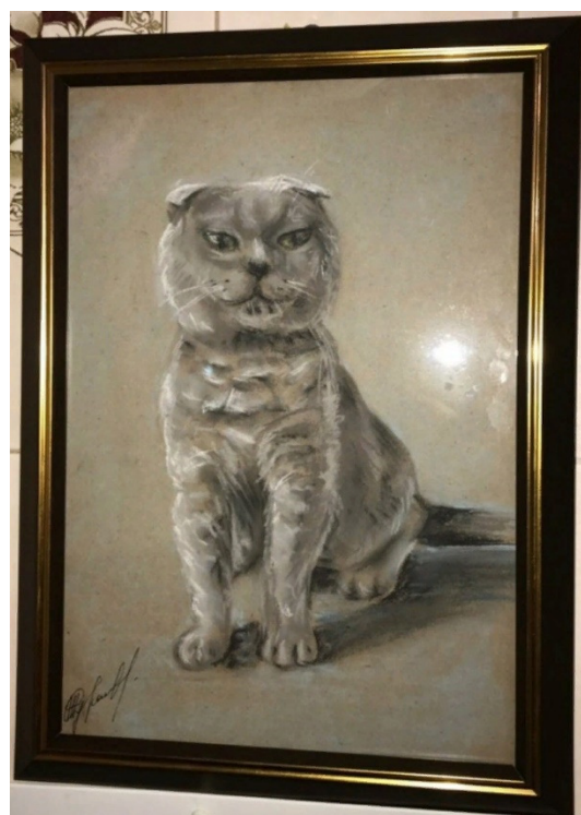
Автор: София Журавлёва

Вечером темным В доме холодном Мысли мои о Лили. Девушка скромно, Так беспокойно Треплет кудри мои.