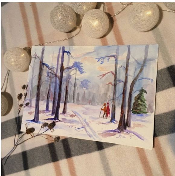
Автор: Алина Смирнова

Ты начала курить сигареты, И пить без причины крепкий нектар. В твоём шкафу бушуют скелеты, В бокале орудует чувств океан. Родная, запомни, умрешь не от градусов Табак не загубит жизненный пыл. Вреднее гораздо, обычное чувство, Что губит веками дев молодых. Красивая сказка, с нелегким исходом, Которую мы называем «Любовь». Симпатия. Глупость. Апатия. Холод. Ты в этой пучине себя не забудь.