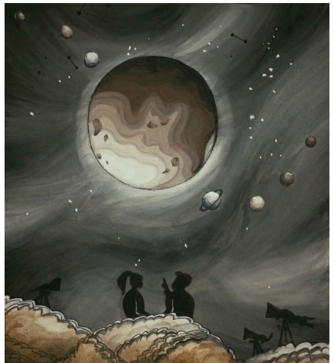
Автор: София Журавлёва